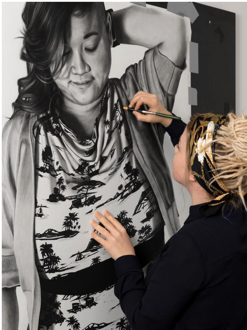
MURZO: F A T 02, Charcoal and graphite drawing, 85 x 127,5 cm, 2018