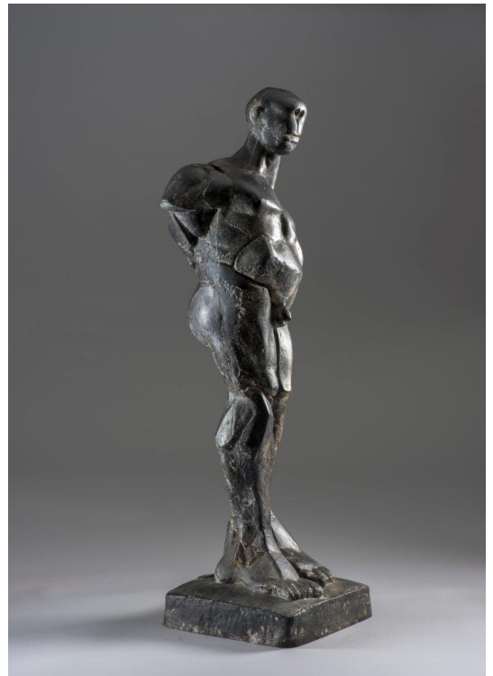
Abbildung: Josef Kostner: Apollo / h87 26x29 / Bronze / 1977

Dennoch, trotz all der Arbeit wollte Kostner seine eigene Kreativität ausleben. Die dazu benötigte Zeit musste er aufgrund der intensiven Beschäftigung im elterlichen Betrieb in seiner Freizeit aufbringen. Er erzählt: „Damals wurde die ganze Woche gearbeitet, von morgens bis abends. Nur die Sonntage und die Zeit nach Feierabend standen zu meiner freien Verfügung. Diese knappe Zeit nützte ich für die Weiterbildung, indem ich bis spät in die Nacht zeichnete und modellierte. Immer häufiger nutzte ich dabei den Ton. Holz erinnerte mich zu sehr an meine Arbeit, bei der ich immer die Wünsche und Vorstellungen anderer verwirklichen musste und sich keine Raum für eine eigene Entfaltung und Interpretation bot.“