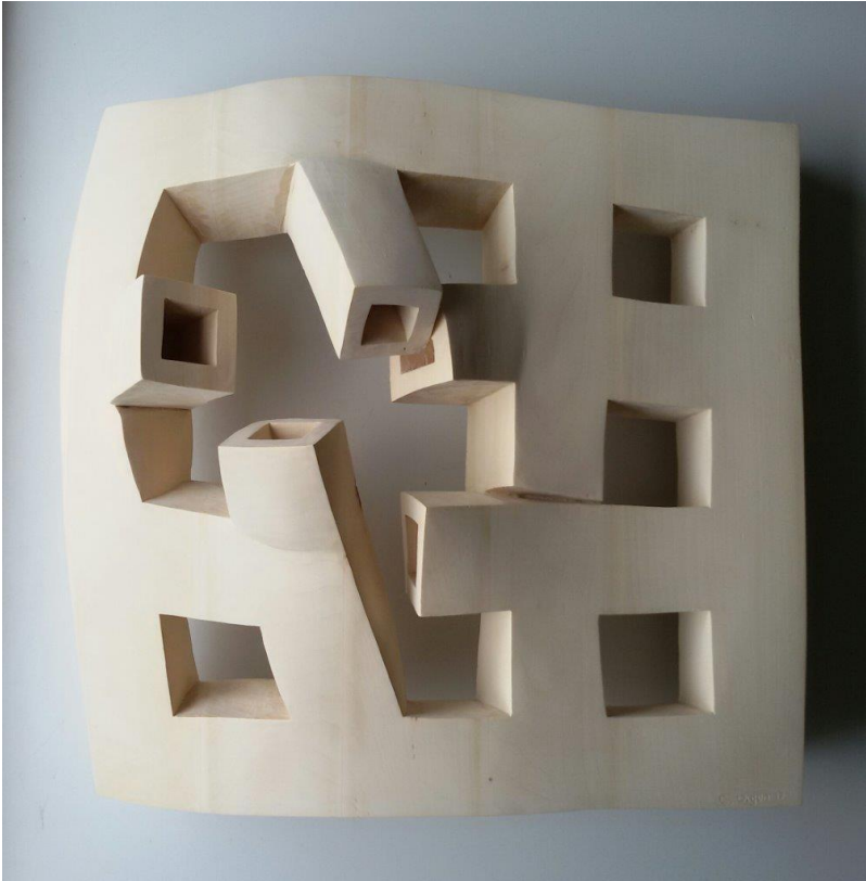
Egon Digon: Offline / 60 x 60 cm / wood / 2017