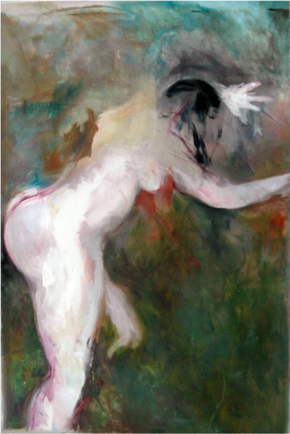
Cornelia Lochmann: Akt / 50 x 80cm / oil on canvas / 2010