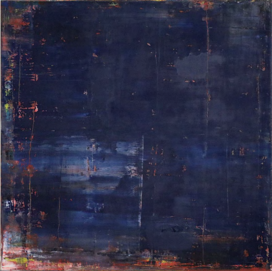
Guido Lötscher: Nr. 1372 untitled / Oil on canvas, 120 x 120 cm, 2021

Spontaneously and at the same time thoughtfully, Guido Lötscher develops his works with numerous layers of paint, scrapings and overlays with squeegee, spatula, and brush. The intuitive intrinsic effect combined with randomness is the focus of his work. In the sequence of addition and subtraction with tools and paint, compositions emerge that are often reminiscent of spatial and landscape depictions.