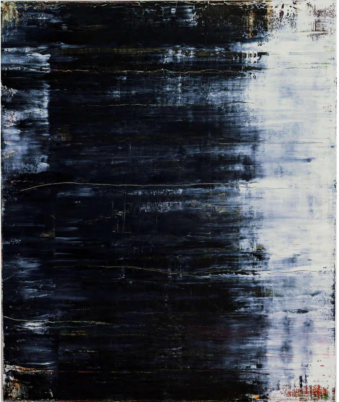
Guido Lötscher: Nr. 1309 untitled / Oil on canvas, 120 x 100 cm, 2021